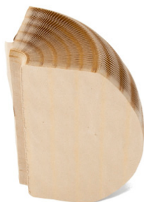
Banqueta Bola fechada