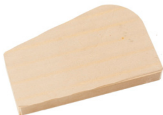
Banqueta Trapézio fechada